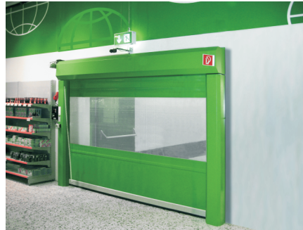
Fluchtwegtor mit verkleideter Wickelwelle und verkleideten Führungsschienen

Bei einem Stromausfall ist die Funktionalität des Tores jederzeit durch die Gegengewichtstechnik gewährleistet. Die Toranlage öffnet selbsttätig und gibt den Fluchtweg frei. Dieser Tortyp wurde vom TÜV SÜD für Flucht- und Rettungswege zertifiziert.