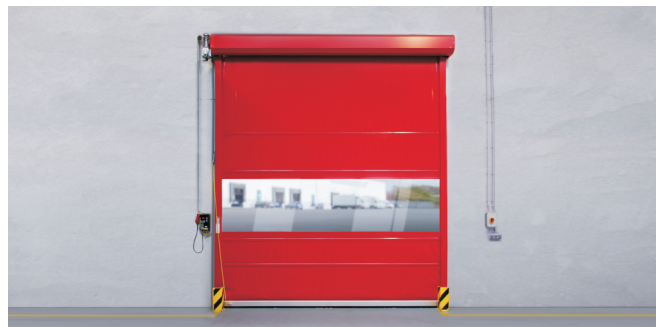
Außentor mit verkleideter Wickelwelle und beschichteten Führungsschienen

Das robuste Außentor bietet auch für größere Toröffnungen Stabilität und Laufruhe. Der Typ KF 5015 wird mit Windsicherung geliefert.